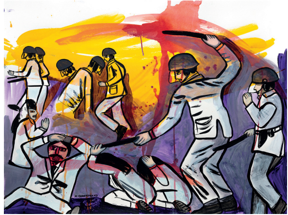
21 • ¡Golpes! •