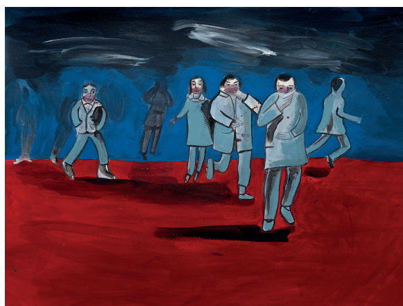
11 • Huelga general •