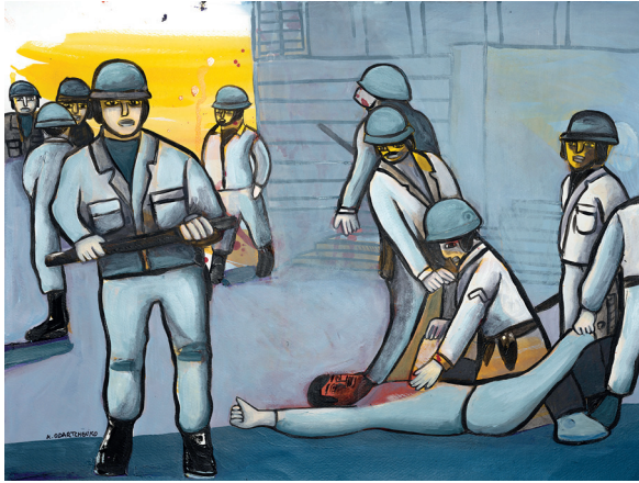
20 • Liberarse •