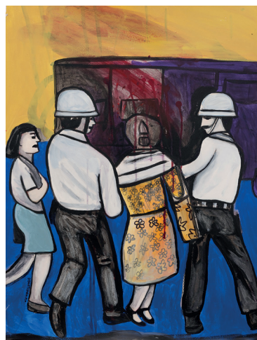
15 • Ellas también lo sufren •