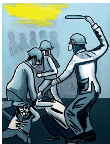
2 • La ligan por zurdos •