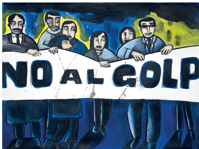
18 • No al golpe •