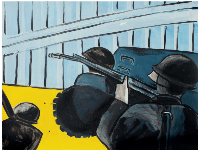
22 • Disparando al pueblo •