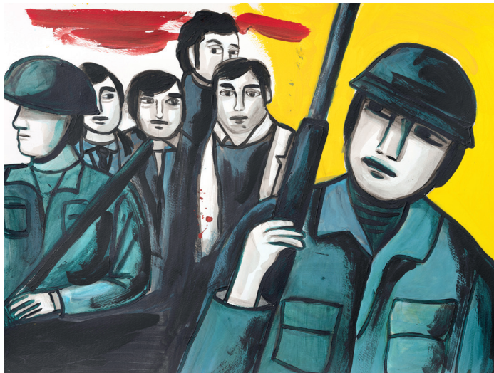
23 • Bajo custodia •