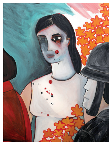
3 • Madre despidiendo a su hijo •