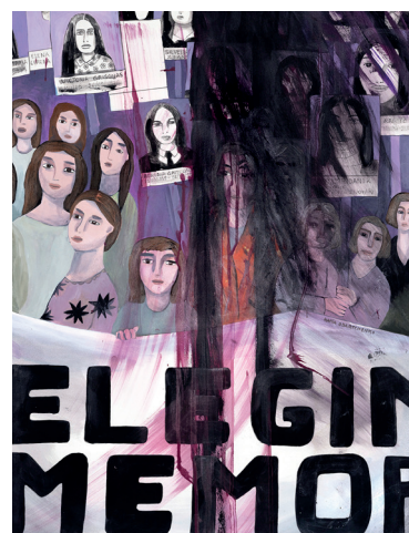
6 • Elegimos memoria •