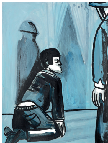
14 • De rodillas •