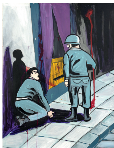
7 • Acá mando yo •