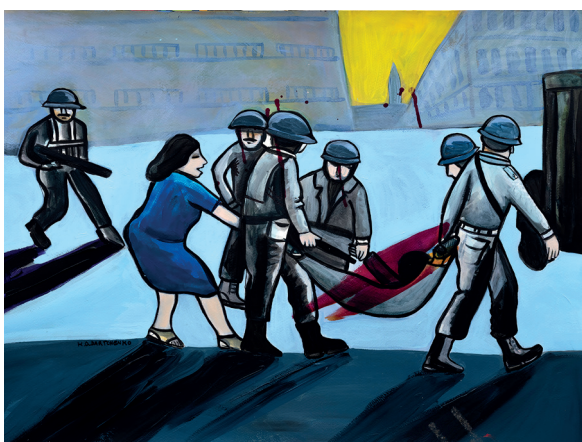
12 • La única lucha que se pierde es la que se abandona •