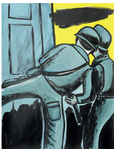
4 • Allanamiento •