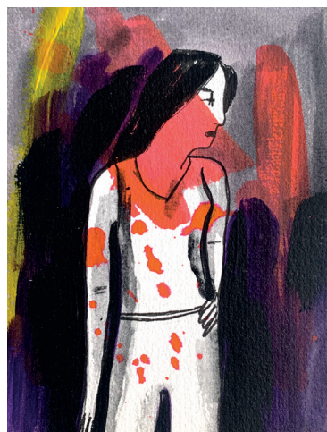
17 • Gente sangrando •