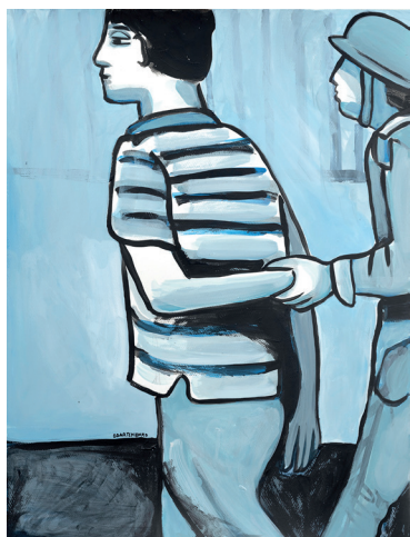
16 • Inocencia violada •