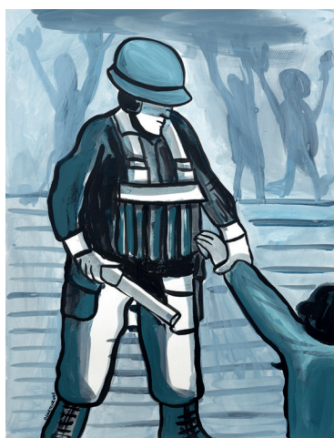
5 • Arrastrado del brazo •