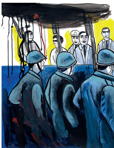
1 • El golpe •