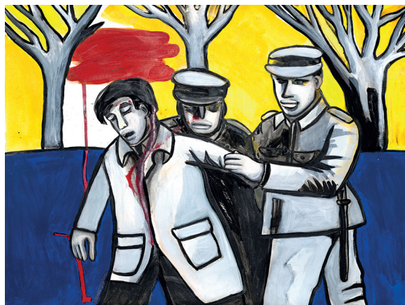
9 • ¿Dónde estará? •