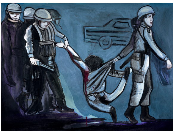
10 • Represión •