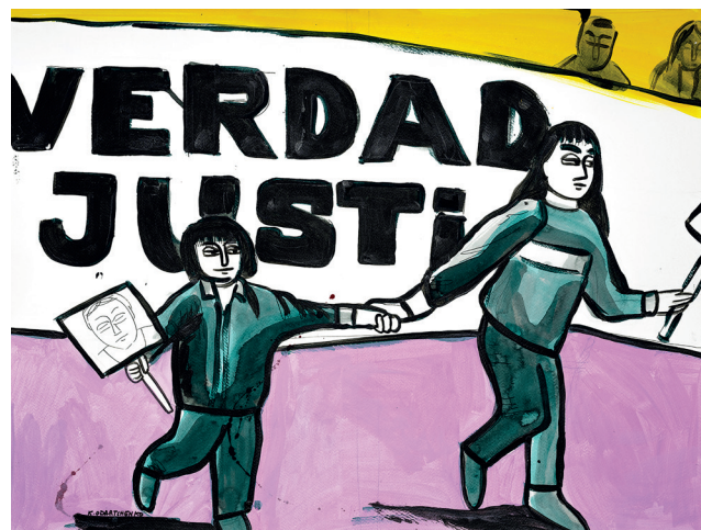
19 • Verdad y justicia •