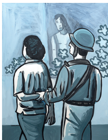
6 • Me lo llevo •