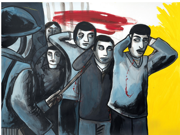
8 • Detenidos desaparecidos •